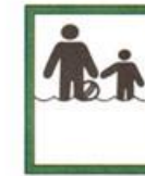
Место купания детей