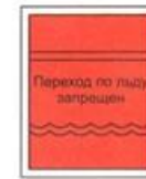
Переход по льду запрещен