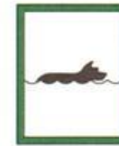
Место купания животных