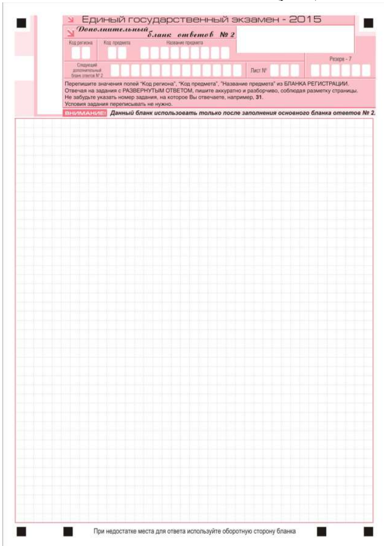
Рис. 10. Дополнительный бланк ответов № 2